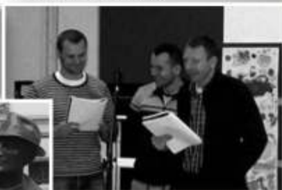
Na jednej z prób spektaklu teatralnego w świetlicy GOK Lesznówola w Janczewicach

- Tak, to prawda. Razem z narzeczoną ćwiczymy wytrwale taniec nie tylko ten pierwszy, ale także mnóstwo innych, aby na naszym weselu, które odbędzie się 29 września nie dać plamy. (śmiej)