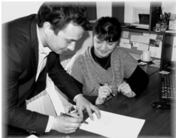
Uroczyste podpisanie Porozumienia pomiędzy nowymi Partnerami.

Strona internetowa Klubu: www.xracingteam.pl