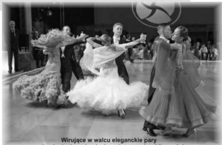
Wirujące w walcu eleganckie pary zapierały dech w piersiach zachwyconej publiczności.

Jak co roku wczesną wiosną odbyło się w gminie Lesznowola wielkie i niezwykle barwne widowisko taneczne: GD DANCE SHOW 2012 GRAND PRIX POLSKI OGÓLNOPOLSKI TURNIEJ TAŃCA TOWARZYSKIEGO O PUCHAR WÓJTA GMINY LESZNOWOLA.