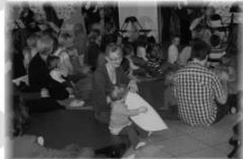
Muzycy nie tylko pięknie zagraли, ale i zainteresowali wszystkich gości niezwykłą budową ciekawych instrumentów muzycznych z dawnych epok. Dzieci i ich opiekunowie bawili się znakomicie.