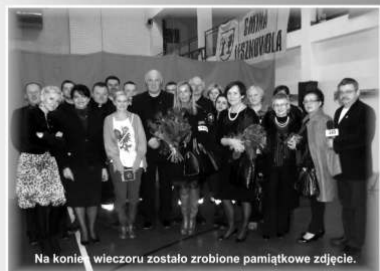
Na koniec wieczoru zostało zrobione pamiątkowe zdjęcie.