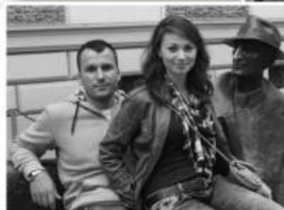
Na jednej z wielu wycieczek po kraju i świecie - tu: w Łodzi, na jednej ławeczce z piękną narzeczoną i wielkim poetą Julianem Tuwimem.

- Serdecznie gratuluję naukowych i artystycznych planów i życzę samych sukcesów we wszelkich dziedzinach. W sprawach rodzinnych zwłaszcza.